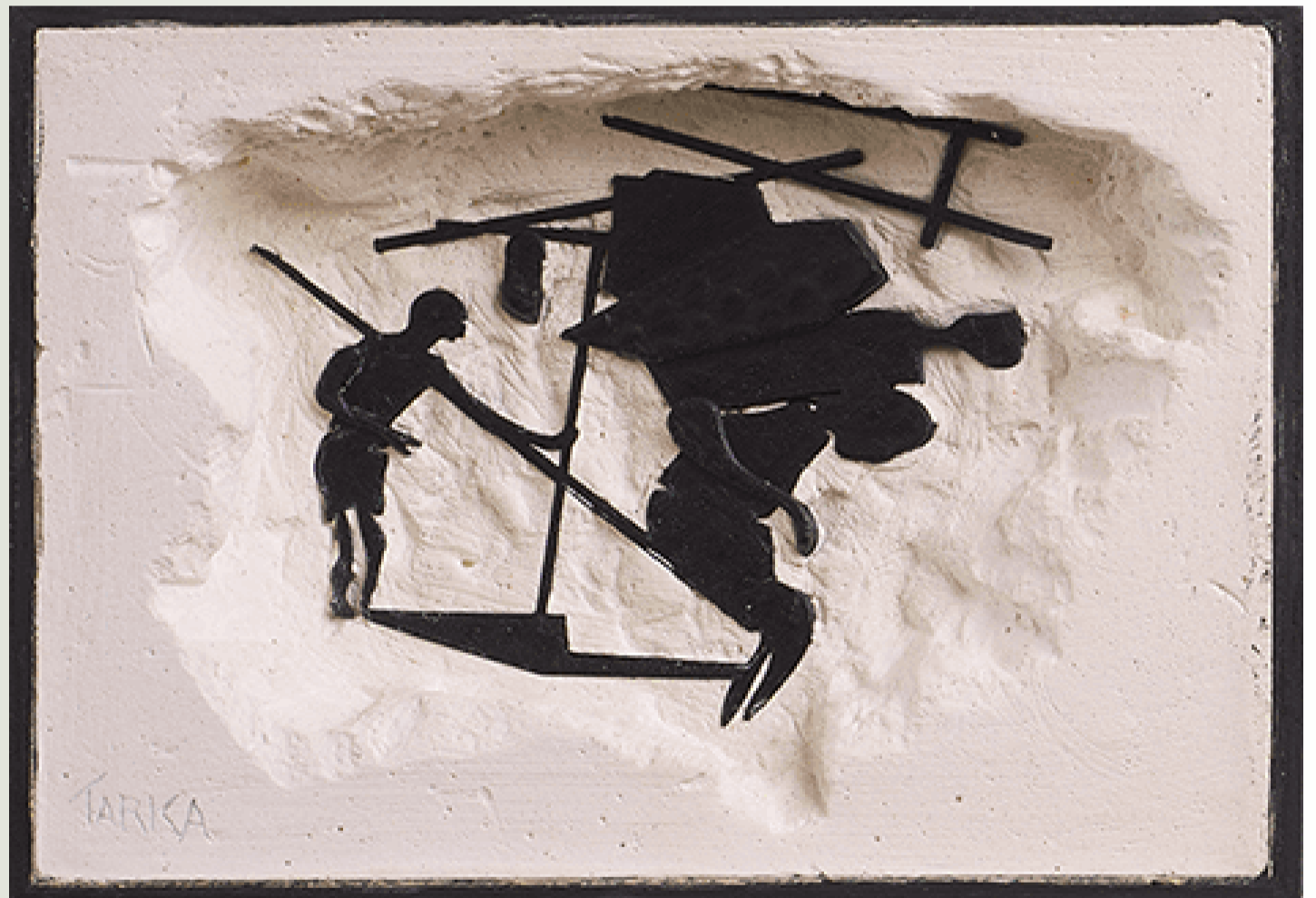
הדימוי: "1984", משה טרקה, יציקת גבס על פלסטיק, 27*27 ס"מ (2021), מתוך הסדרה "חשופים".