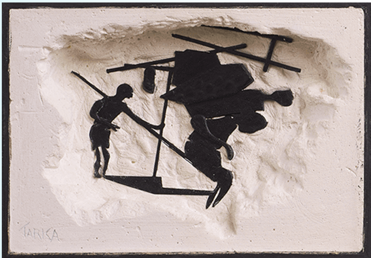
הדימוי: "1984", משה טרקה, יציקת גבס על פלסטיק, 27*27 ס"מ (2021), מתוך הסדרה "חשופים".